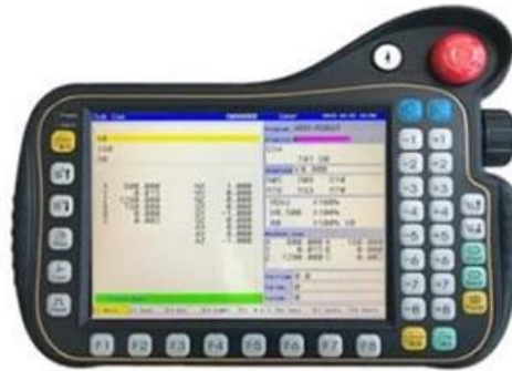
cnc robot controller